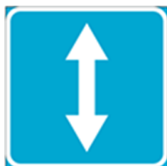
знак 561 «Реверсивное движение»

С помощью дорожных знаков и дорожной разметки вы сможете понять, что выезжаете на дорогу, где есть полоса или несколько полос с реверсивным движением. Знаки устанавливаются в начале и в конце полосы.