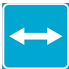
знак 563 «Выезд на дорогу с реверсивным движением»

обозначает конец участка дороги, обозначенного знаком 561 «Реверсивное движение».