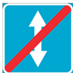
знак 562 «Конец реверсивного движения»

обозначает начало участка дороги, где на одной или нескольких полосах направление движения может изменяться на противоположное с помощью реверсивных светофоров или знаков 535 «Направление движения по полосам».